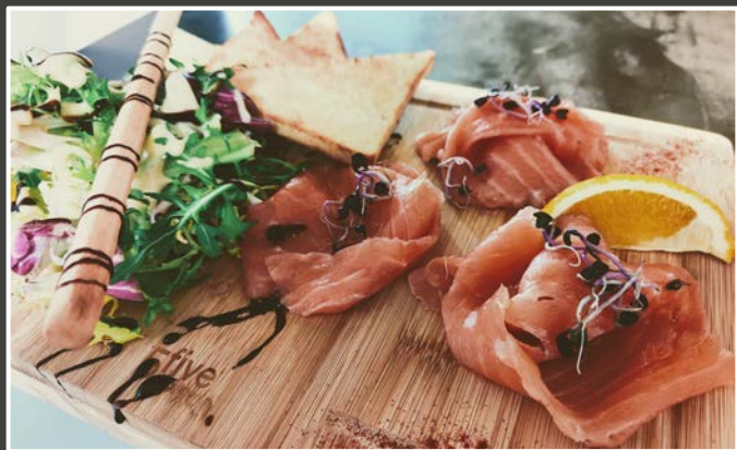
Saumon Gravlax et ses toast 12.90€