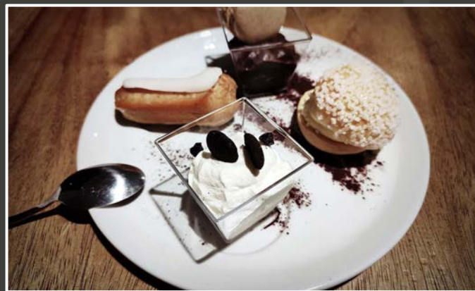
Assiette Gourmande 6.50€