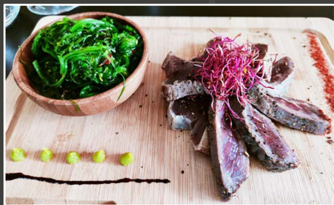
Duo Tataki de Thon & Boeuf 17.50€