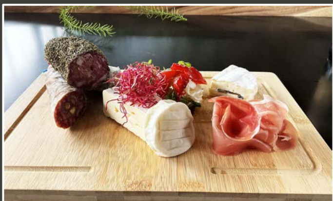
Charcuterie & fromage 25€